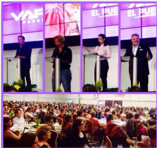
Líderes de la Alianza “El Pueblo Primero” durante el Encuentro de Mujeres Independientes.

El 10 de marzo, se realizó el "Encuentro de Mujeres Independientes" con la participación de más de mil mujeres. Juan Carlos Varela e Isabel Saint Malo De Alvarado, fórmula presidencial de la Alianza “El Pueblo Primero”, acompañados de Milton Henríquez, Presidente del Partido Popular (PP) de Panamá, aprovecharon la oportunidad para socializar su plan de trabajo en el marco del fortalecimiento de la mujer como uno de los pilares para el desarrollo social y democrático del país.