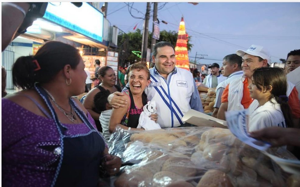
Tony Saca, excandidato presidencial por el movimiento UNIDAD, agradece a pobladores por el apoyo recibido en su campaña proselitista.

El excandidato presidencial del movimiento UNIDAD, Tony Saca, agradeció a quienes votaron por la fórmula presidencial que él encabezó, el apoyo y confianza que mostraron hacia el movimiento UNIDAD durante la campaña electoral que culminó el 2 de febrero de 2014. Además, reiteró su compromiso de respetar los resultados emitidos por el Tribunal Supremo Electoral (TSE), con respecto a la segunda vuelta electoral entre los candidatos presidenciales Norman Quijano, de La Alianza Republicana Nacionalista (ARENA), y Salvador Sánchez Cerén, del Frente Farabundo Martí para la Liberación Nacional (FMLN).