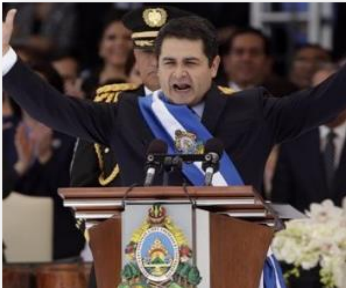
Juan Orlando Hernández, presidente de Honduras.

En el discurso que pronunciara al asumir el 27 de enero de 2014 el Presidente de la República de Honduras, Juan Orlando Hernández, agradeció a la población hondureña el apoyo y confianza que le han manifestado.