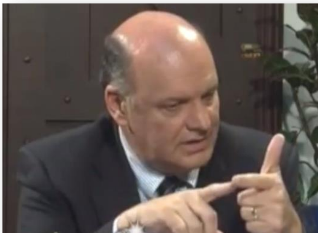
Rodolfo Piza, excandidato presidencial del PUSC.

En una entrevista con el semanario El Financiero , Rodolfo Piza, excandidato presidencial del Partido Unidad Social Cristiana (PUSC), enfatizó en la necesidad de fortalecer la unidad interna del PUSC y buscar consensos en la Asamblea Legislativa para implementar diversos programas y proyectos que contribuyan al desarrollo integral en Costa Rica.