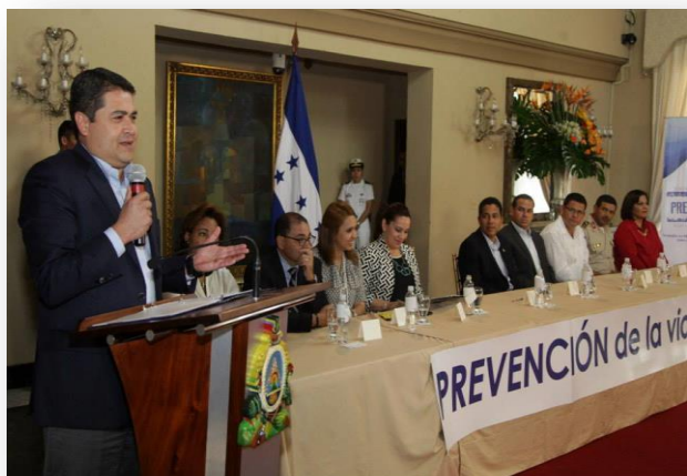
Juan Orlando Hernández, presidente de Honduras (2014-2018), durante la Instalación de mesas de prevención en Seguridad.

Durante las primeras cinco semanas de gestión del nuevo gobierno, se han implementado cinco medidas en relación a la transparencia, Vida Mejor, recuperación de la paz, generación de empleo, y promoción de inversiones.