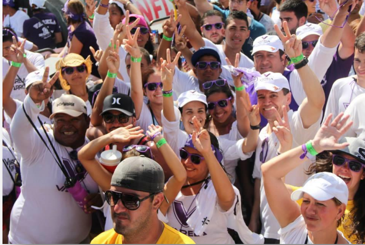
Juventud del Partido Popular (PP) de Panamá y miembros del movimiento Fuerza Varela.

En el mes de febrero de 2014, con la participación de más de 500 jóvenes, miembros de la organización Atrévete por Panamá, Patria Verde, Estudiantes con Varela, Juventud Panameñista, y Juventud del Partido Popular (PP), se realizó el lanzamiento del movimiento “Fuerza Varela”, con el propósito de respaldar a la Alianza “El Pueblo Primero” en su lucha por el fortalecimiento institucional y democrático del país.