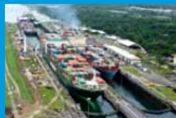
La construcción del Canal interoceánico en Nicaragua, iniciaría en 2015.

No obstante, en telecomunicaciones, ha existido interés de la empresa Xinwei, liderada también por Jing, para la incorporación de la tecnología 4G en el país, se espera que esta inversión ronde los $300 millones. Adicionalmente, Xinwei, tomaría Nicaragua como plataforma para la expansión de sus inversiones a la región centroamericana ( El 19 Digital , 06/09/2012). Aunado a ello, la empresa china CAMC Engineering ha invertido en la construcción de una refinería de petróleo. Esta inversión ha rondado los $233 millones. Además, ganó una licitación por 50 millones de dólares para la construcción de 3.8km de tubería submarina para el