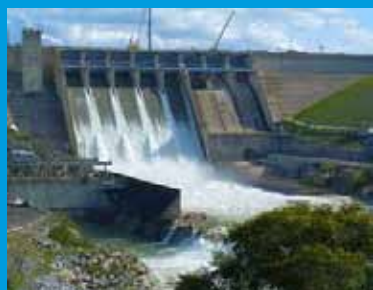
El proyecto hidroeléctrico Patuca III en Honduras comprende tres

Igualmente, la RPCh ha mostrado interés por proyectos hidroeléctricos en los puertos de Amapala y de Trujillo, en Honduras, específicamente