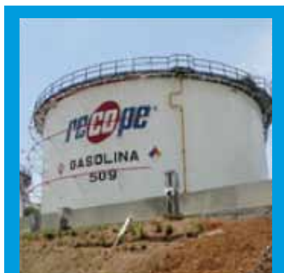
RECOPE busca modernizar la refinadora de la provincia de Limón.

En el caso de Guatemala , la compañía china Tebian Electric Apparatus Stock Co. (TBEA) ha mostrado el interés de colocar sus productos median-