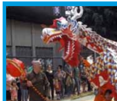
En el año de 2012, se inauguró en San José, Costa Rica, el Barrio Chino.

Por otro lado, el Instituto ofrece el Programa de Becas Instituto Confucio, dirigido a estudiantes y académicos, y el cual se divide en cuatro categorías: 1) Beca para la maestría en Enseñanza del Chino a Hablantes de otras lenguas (MTCSOL), con una duración de dos años, 2) Beca por un año académico más el programa MTCSOL (por un período de tres años), 3) Beca para un año académico de aprendizaje del idioma, y 4) Beca por un semestre académico para el aprendizaje del idioma. Estas becas cubren todos los costos de inscripción y matrícula, la estadía gratuita en los dormitorios de las universidades destino; así como contribuciones por conceptos de relocalización, los cuales varían entre 1000 y 1500 yuanes, dependiendo del tipo de beca; y un estipendio mensual por gastos de vida entre 1500 y 1700 yuanes mensuales.